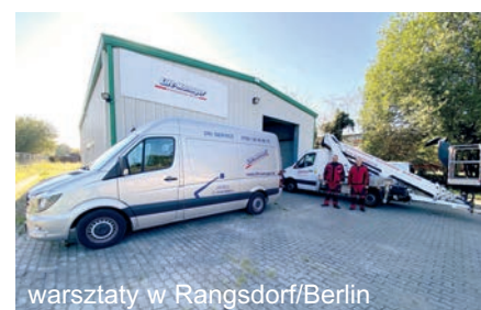
warsztaty w Rangsdorf/Berlin

Niedawno zespoły w naszych spółkach zależnych w Datteln i Breitenfelde powiększyły się z czterech do pięciu techników, a w Berlinie-Rangsdorf zatrudniono drugiego technika serwisowego. Tutaj wynajęto warsztat do przeprowadzenia niektórych napraw pod dachem.